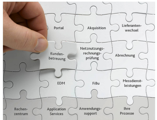
Abb. 2: Geschäftsprozess- und Servicemodule nach dem Baukastenprinzip

können Sie auf unser Plattform-Konzept setzen. Mit der Implementierung eines Prozessbausteins, der bei allen Verbundpartnern angewendet werden kann, erreichen Sie Mengenvorteile.