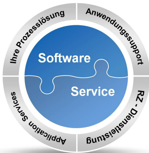
Abb. 1: Prozess- und bedarfsorientierte Lösungen

Mit der Shared Service Plattform (SSP) sind wir in der Lage, Ihnen als Energieversorger deutschlandweit eine modulare Lösung für Ihre Geschäftsprozesse anzubieten. Flexibel können Sie einzelne Prozesse von der IT bis hin zur Geschäftsprozessbearbeitung auslagern. Sowohl die Anforderungen der Netzbetreiber (Mandant „Netz“) als auch die der Energielieferanten (Mandant „Vertrieb“) werden mit unserer Lösung abgedeckt. Sie können zudem zwischen reinen IT-Services (ASP - Application Service Providing) und einem umfassenden Business Process Outsourcing (BPO) wählen. Bei uns bekommen Sie alle Services aus einer Hand.